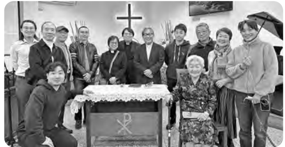
←復興教会の皆さんと再会して