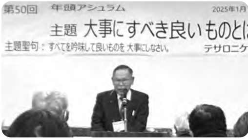
80代、信仰の灯は消えることなく、ますます明るく！